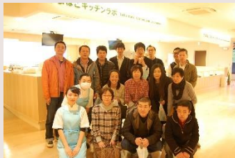
風祭の鈴廣さんで「揚げかまぼこ作り」。出来立ては格別でした。