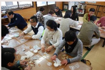
寄木でコースター作り体験

12月の休館日にスタッフ研修を行いました。通常はAED研修や避難訓練、消防機器取り扱い実習等を行っていますが、今回は趣向を変えて「寄木細工制作体験」と「かまぼこ作り体験」を行ってきました。久し振りにみんな揃って外出し、ミニ遠足気分でリフレッシュ。実体験を基に今後のお客様への観光案内に役立てます。