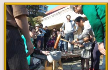
穏やかな元日。皆様と一緒に力を合わせて「餅つき大会」。その後、美味しくいただきました。