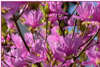
<コバノミツバツツジ>

すらっとした姿が特徴の落葉性ツツジ。庭園のツツジの中ではヒカゲツツジやアセビに続き開花します。花期は比較的短く、開花から10日ほどで散りはじめます。